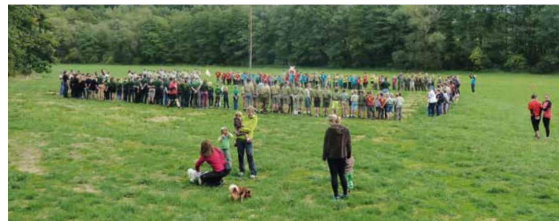
Srazu tomíků u Zbyslavic na Ostravsku se zúčastnilo přibližně 300 zájemců

příznivý. O víkendu 21.–23. září 2018 dorazily tři stovky tomíků z Moravskoslezské oblasti a také z oblasti Valašsko-Chřiby. Celý víkend se pak utkávaly nejen v soutěži o hlavní ceny, tedy tři Štíty vítězů, ale také v mnoha dalších turistických a tábořnických dovednostech, počínaje uzlováním a lasováním a soutěží kronik a deníků konče. Akce zařazená mezi „stoleté a stotřicetileté“ vyvrcholila nádherným táborákem a muzicírováním do brzkých ranních hodin. Putovní ceny za hlavní srazovou soutěž „Pětiboj“ si odvezli dívky z TOM KADAO Opava, chlapci z TOM Zlaté šípy Valašské Meziříčí a veteráni z TOM Čmoudík Ostrava. Upravené louky byly v neděli využity také k uskutečnění indiánského turnaje Lagori cup, který na jaře