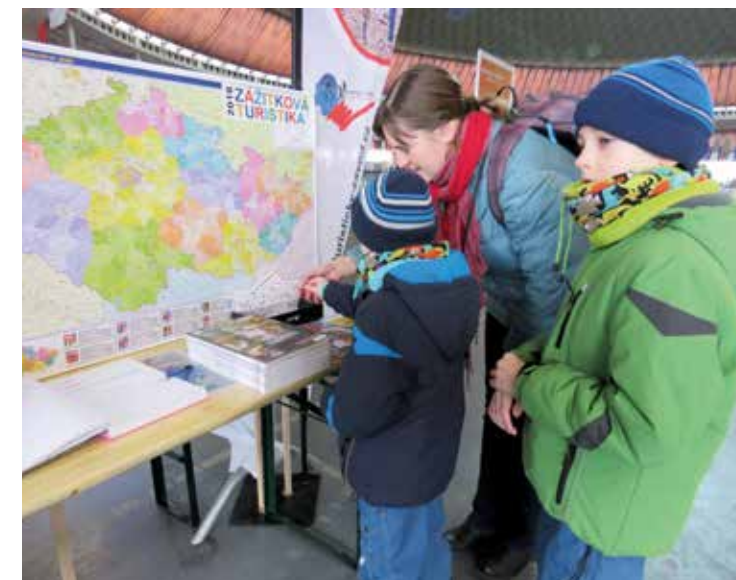
Zážitková turistika byla představena hned na 18 akcích

1. outdoorový turistický závod (představení závodů jednoduchou formou v délce trvání cca 5–7 minut pro jednoho závodníka, se zaměřením na