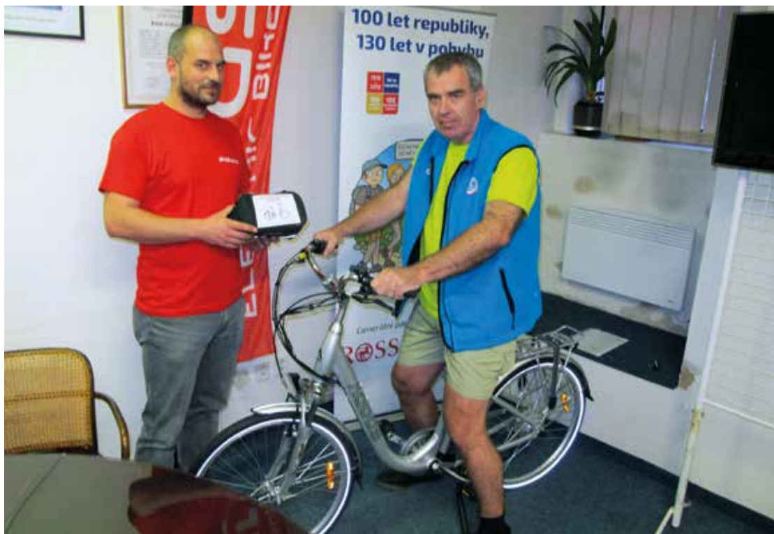
Předání hlavní ceny Velkého stoletého losování - elektrokola

celkem 700 výher v hodnotě 185 tisíc Kč. Sponzory projektu byly firmy ROSSMANN, Lidé a hory, Kam po Česku, Lidé a Země, Siko koupelny, Asociace horských středisek ČR, Káva z Regionu a další. Tzv. Velké stoleté losování o zajímavé ceny (např. elektrokolo, jízdní kolo, sportovní tašky či dárkové poukazy) v hodnotě 85 tisíc Kč se uskutečnilo 28. října 2018 na náměstí Republiky v Praze. Podmínky sběratelské soutěže splnilo 293 osob.