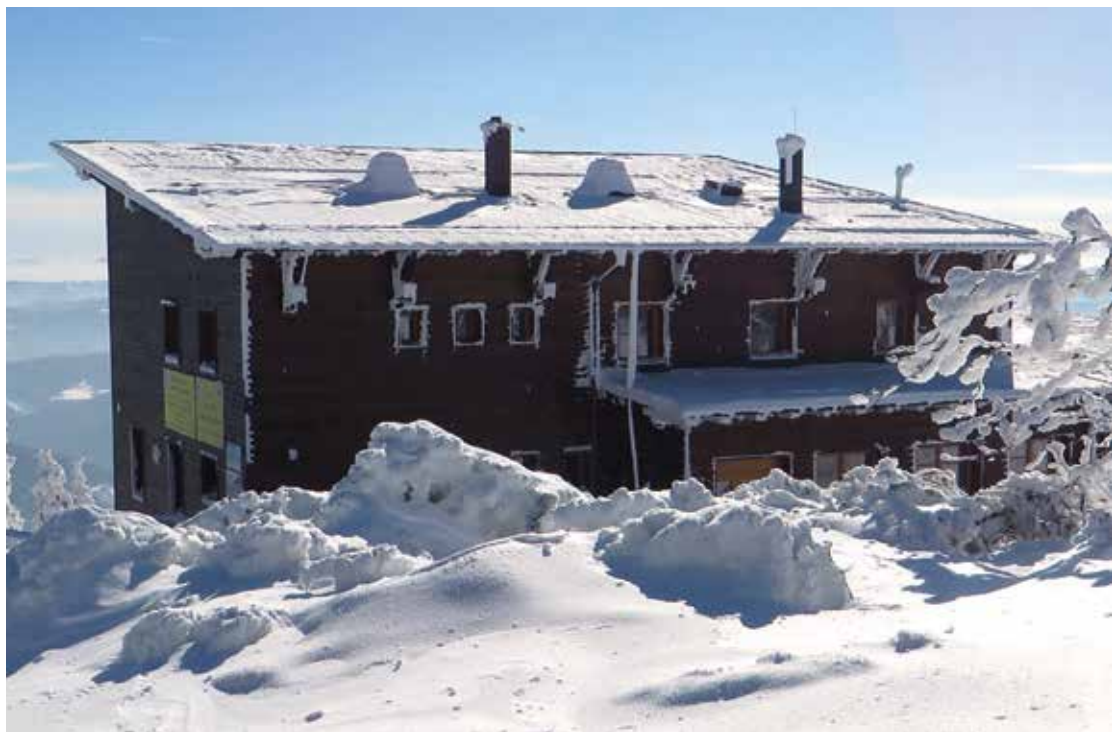
Bezručova chata na Lysé hoře